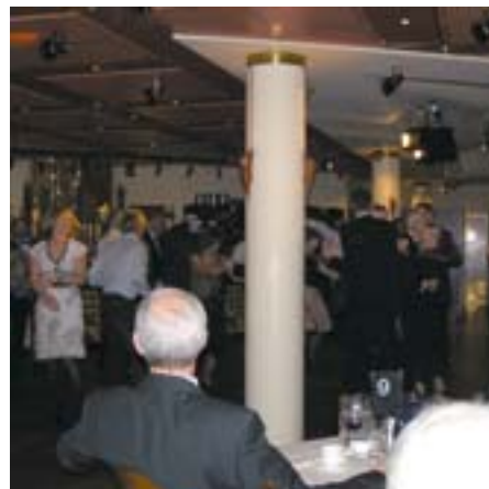
...og dansen gik