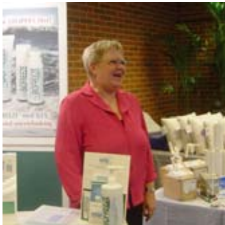
Marianne Skovsgaards agentur