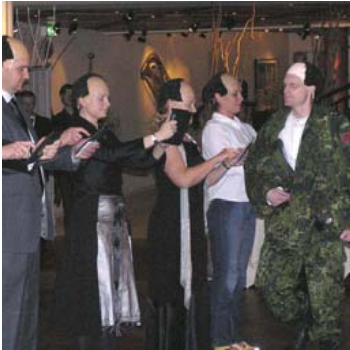
Bestyrelsen parodierer formanden